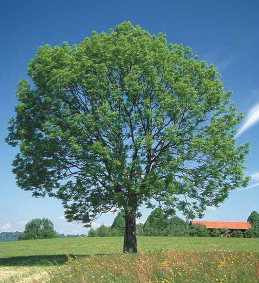
Esche, Wirtsbaum der Eschen-Mistel ( Viscum album , Fraxini)