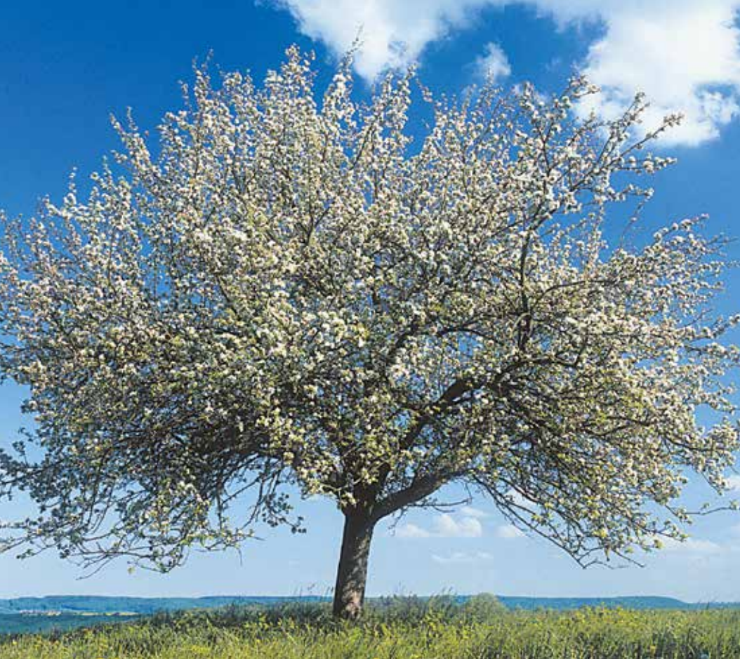
Apfelbaum, Wirtsbaum der Apfel-Mistel ( Viscum album , Mali)