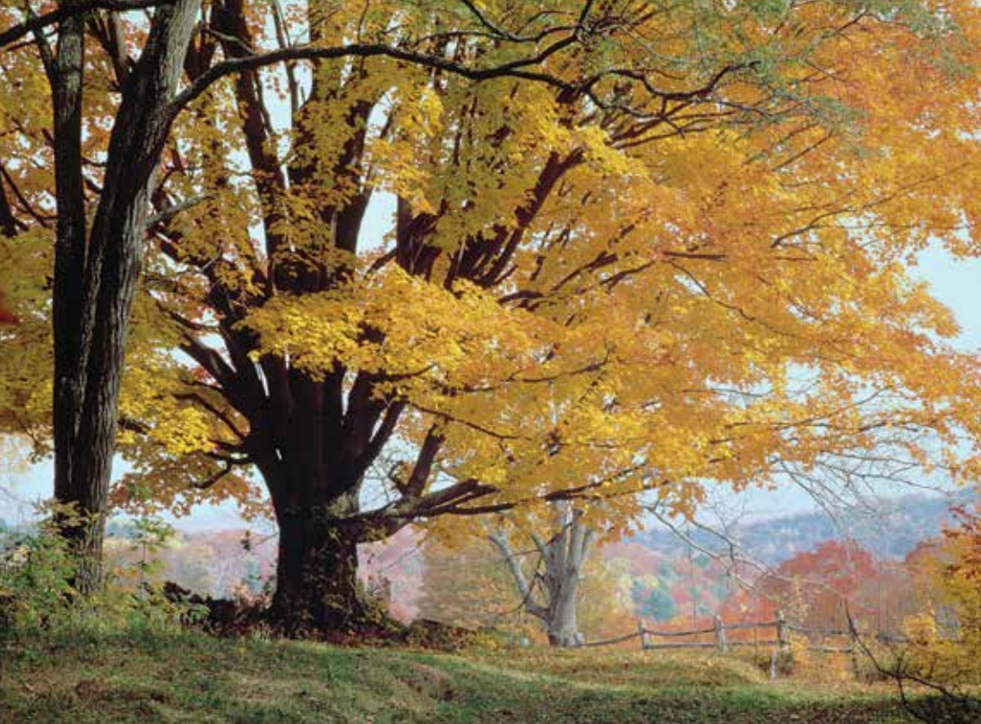
Ahorn, Wirtsbaum der Ahorn-Mistel ( Viscum album , Aceris )