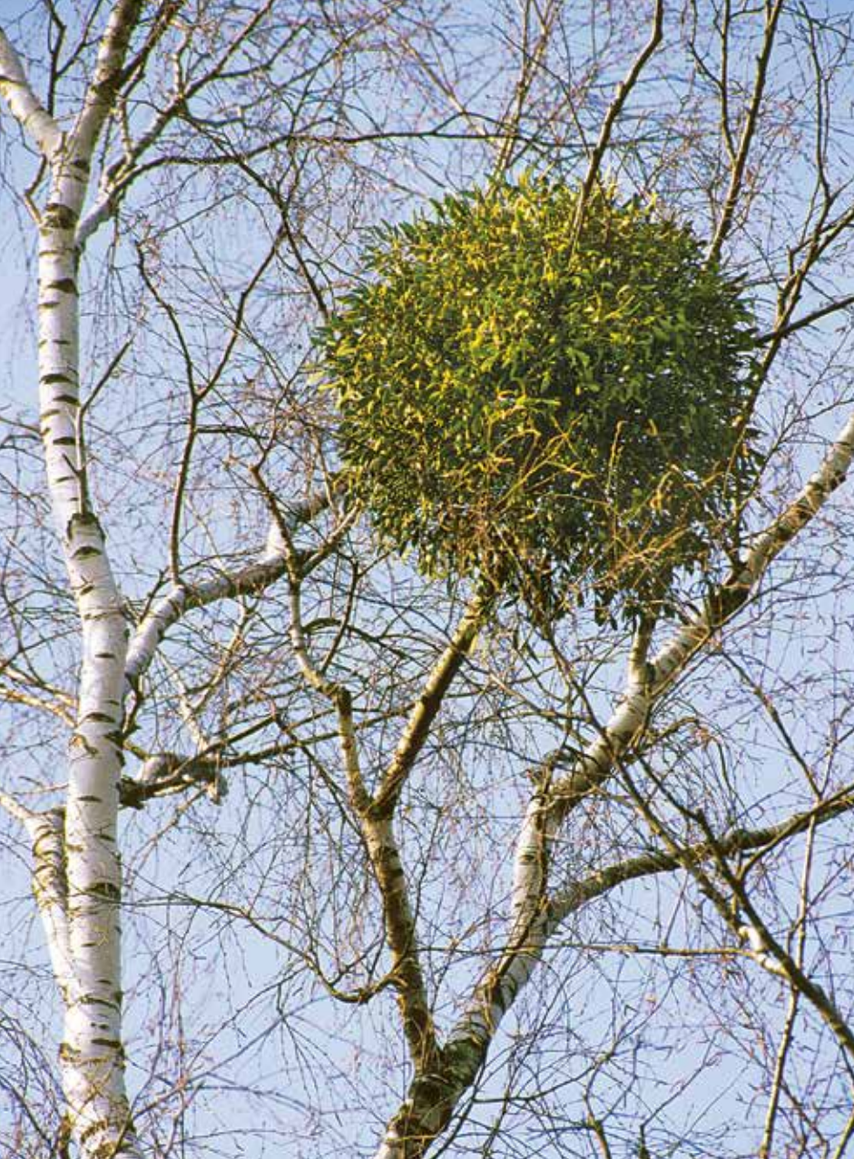
Mistelbusch im Winter, Birke, Wirtsbaum der Birken-Mistel ( Viscum album , Betulae )