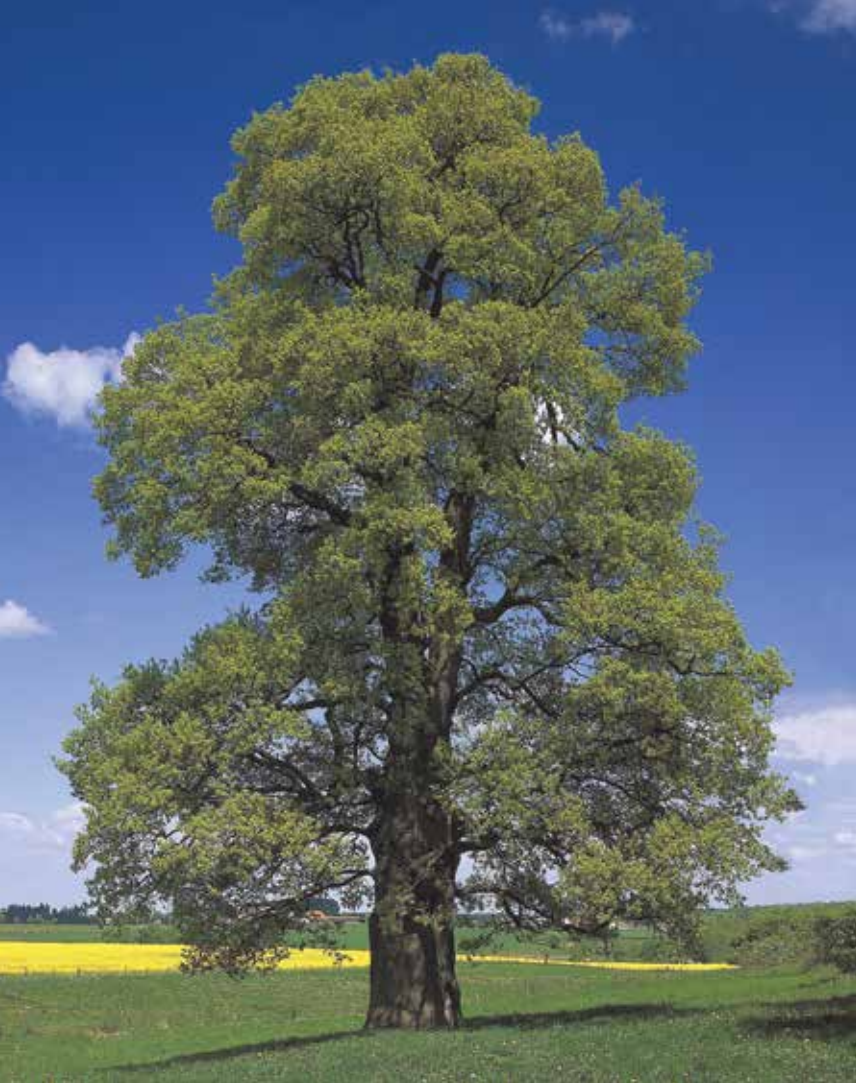
Eiche, Wirtsbaum der Eichen-Mistel ( Viscum album , Quercus )