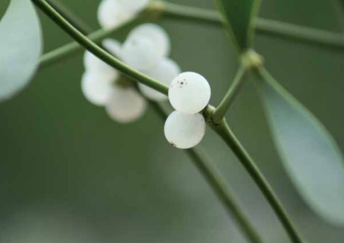
Mistelzweig im Winter

Dauer-Therapie = ist die auf die anfängliche Therapie folgende Therapie. Diese Therapie wird in der Regel mit einer gleich bleibenden Dosierung über mehrere Jahre durchgeführt.