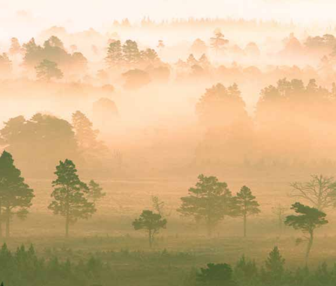
Kiefer, Wirtsbaum der Kiefern-Mistel ( Viscum album , Pini)

Weiter wird zwischen lokalen Therapien , die einen Tumor direkt durch Operation, Strahlentherapie oder gezielte Medikamentengabe bekämpfen, und den sog. systemischen Therapien unterschieden. Systemische Therapien wirken zytostatisch oder hormonell und unterdrücken das Wachstum erkrankter Zellen und Gewebe im ganzen Körper oder regen, wie die Misteltherapie, das Immunsystem in seinen Funktionen gegen den Krebs an.