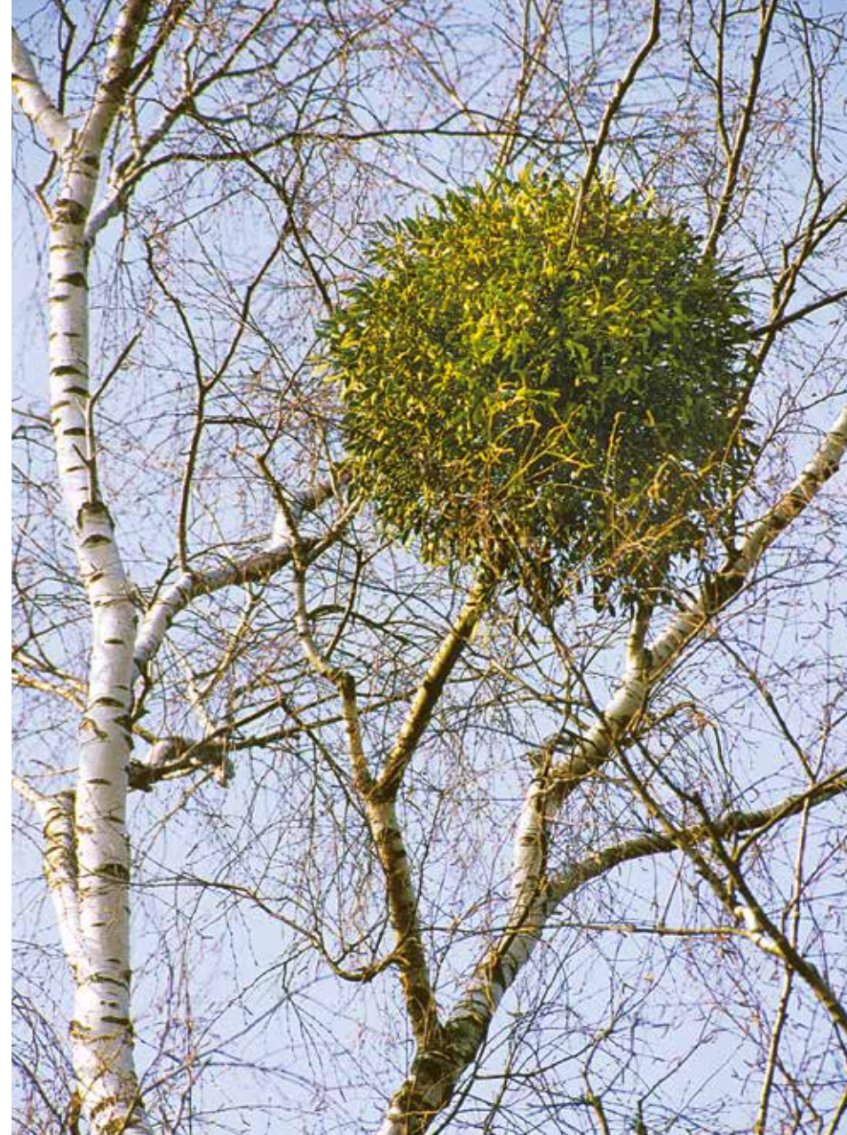
Mistelbusch im Winter, Birke, Wirtsbaum der Birken-Mistel ( Viscum album , Betulae )

ist hier im Sinne einer ganzheitlichen, ergänzenden Behandlung des erkrankten Patienten zu verstehen. Der starke Eingriff in den Hormonhaushalt des Patienten bedarf einer begleitenden Immunmodulation, wie sie zu Beginn des folgenden Kapitels beschrieben wird.